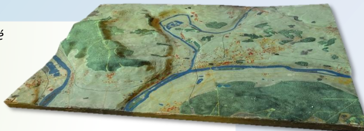
L'Hautil et le confluent en 3D il y a 50 ans...