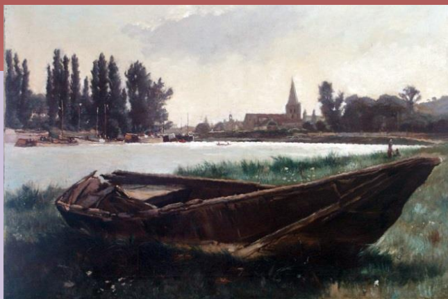
Bords de la Seine aux environs d'Andrésy, après 1879